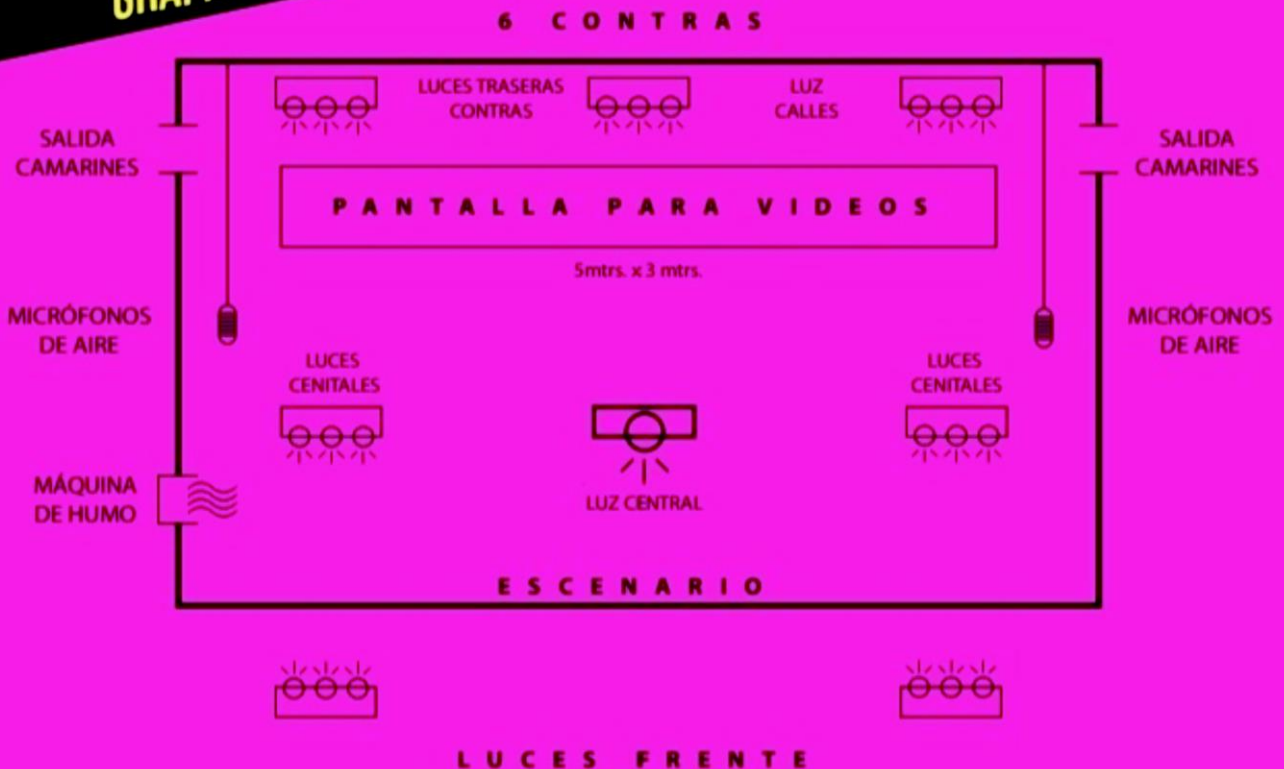
GRAFICO DE REQUERIMIENTO